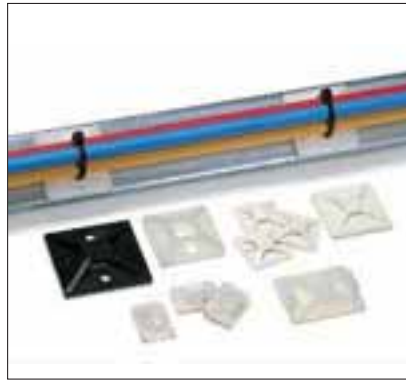
Festesokler MB og TY.

Leveres i både skru- og selvklebende utførelse. Enkle å installere med en skrue eller nitte, og gir en utmerket sikkerhet, spesielt i områder med store vibrasjoner. De selvklebende festene gir en maksimal festeflate, og i kombinasjon med det spesialutviklede limet får man en meget sikker og sterk festing. MB-festene har 4-veis inngang for buntebåndet, og gir derved en enda mer fleksibel installasjon.