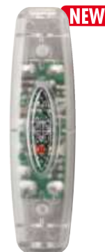
RH SNELLO LED T cod. RL7165/LED