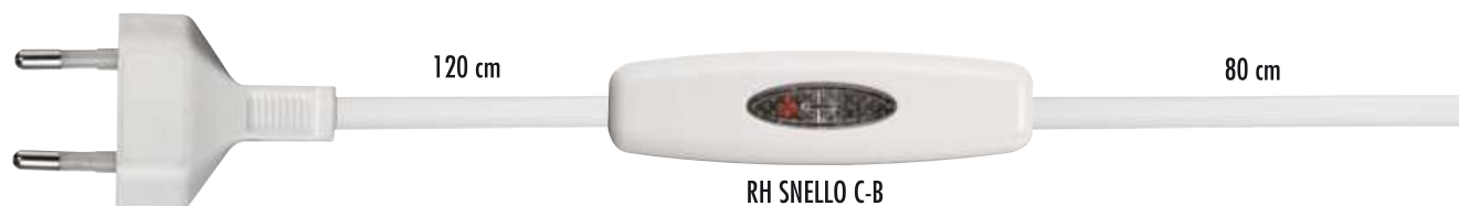
RH SNELLO C-B cod. RL7155/E1