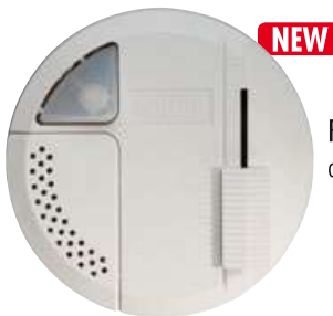
RONDÓ B LED cod. RS5618/led