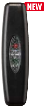
RH SNELLO LED N cod. RL7150/LED