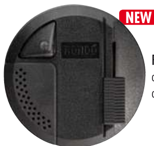
RONDÓ N LED cod. RS5600/led (50pz) cod. RL5600/led (10 pz)