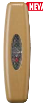
RH SNELLO LED P cod. RL7160/LED