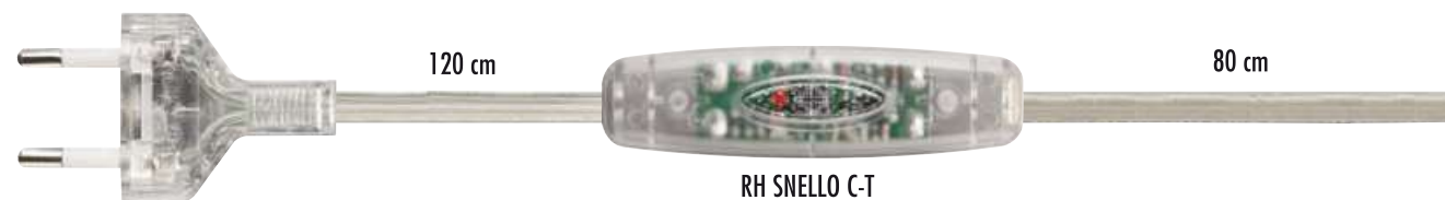
RH SNELLO C-T cod. RL7165/E1