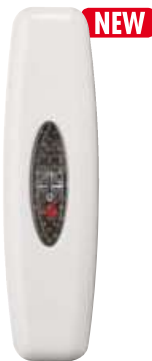
RH SNELLO LED B cod. RL7155/LED