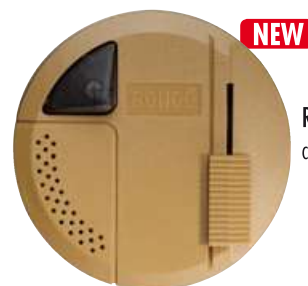
RONDÓ P LED cod. RQ1205/led