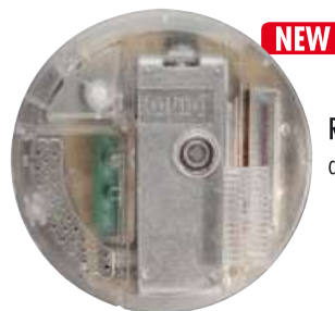
RONDÓ T LED cod. RS5640/led

*10 lampadine max è il numero garantito e verificato da L.C. RELCO, non esiste uno standard costruttivo per le lampade a LED quindi il dispositivo potrebbe funzionare correttamente anche con un numero maggiore, 15÷20, previa verifica ufficio tecnico L.C. RELCO.