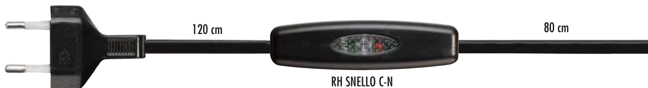
RH SNELLO C-N cod. RL7150/E1