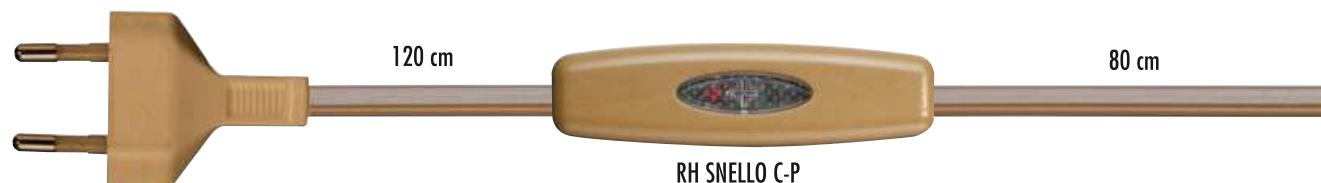
RH SNELLO C-P cod. RL7160/E1