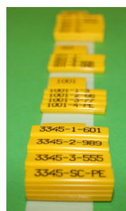
Sorterat på ark