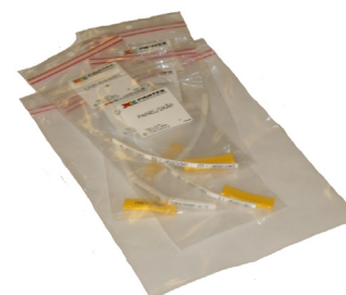
Dubbelsorterat per kabel och skåp