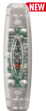
RH SNELLO LED T cod. RL7165/LED