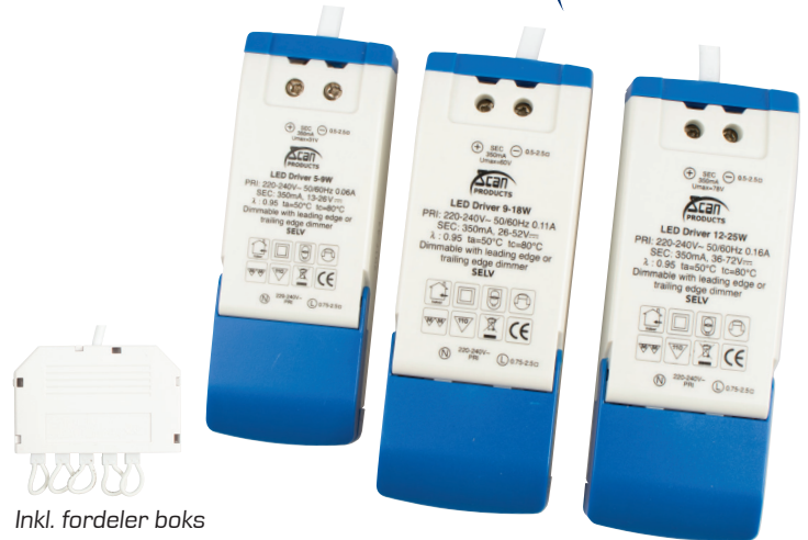
Inkl. fordeler boks