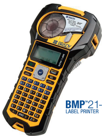
BMP™21-PLUS LABEL PRINTER